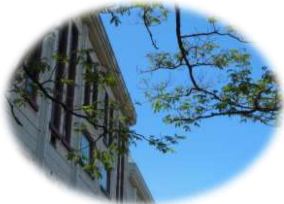
「ねむの木」の若葉と創造館

所在地 飯田市小伝馬町1丁目 3541-1 〒395-0013 電話 0265-52-0333 FAX 0265-52-0081 E-mail idasozo@naganobunka.or.jp 休館：水曜日 指定管理者 一般財団法人 長野県文化振興事業団