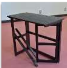
折りたたんだ状態