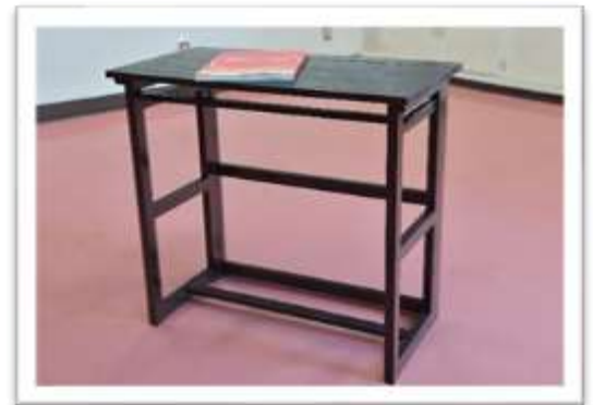
A:① 折りたたみテーブル 色：ダークブラウン